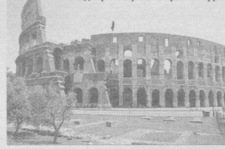
Шедевры мировой архитектуры.