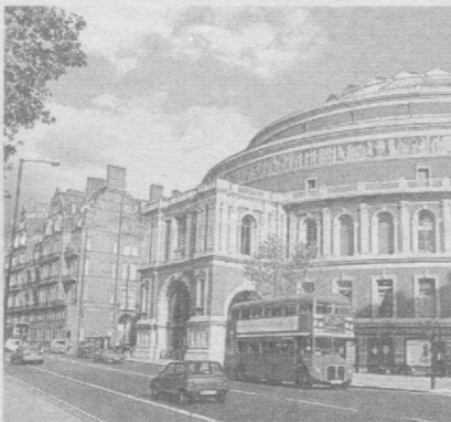
Шедевры мировой архитектуры.