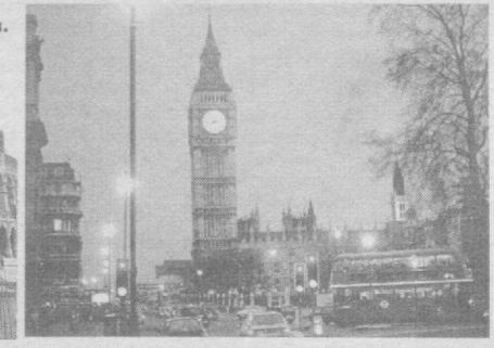
Подборка подготовлена по материалам ИА «Жахон» и НИА «Туркистон-пресс».