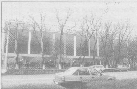
Автомобильная магистраль — неотъемлемая часть городского пейзажа. Приятно, что именно строительству дорог и их модернизации в нашем городе уделяется большое внимание. Карта автомобильных дорог, ширина и качество покрытия дают возможность всем нам быстро, без «пробок» перемещаться по городу. И... любить при этом красоту любимого Ташкента.