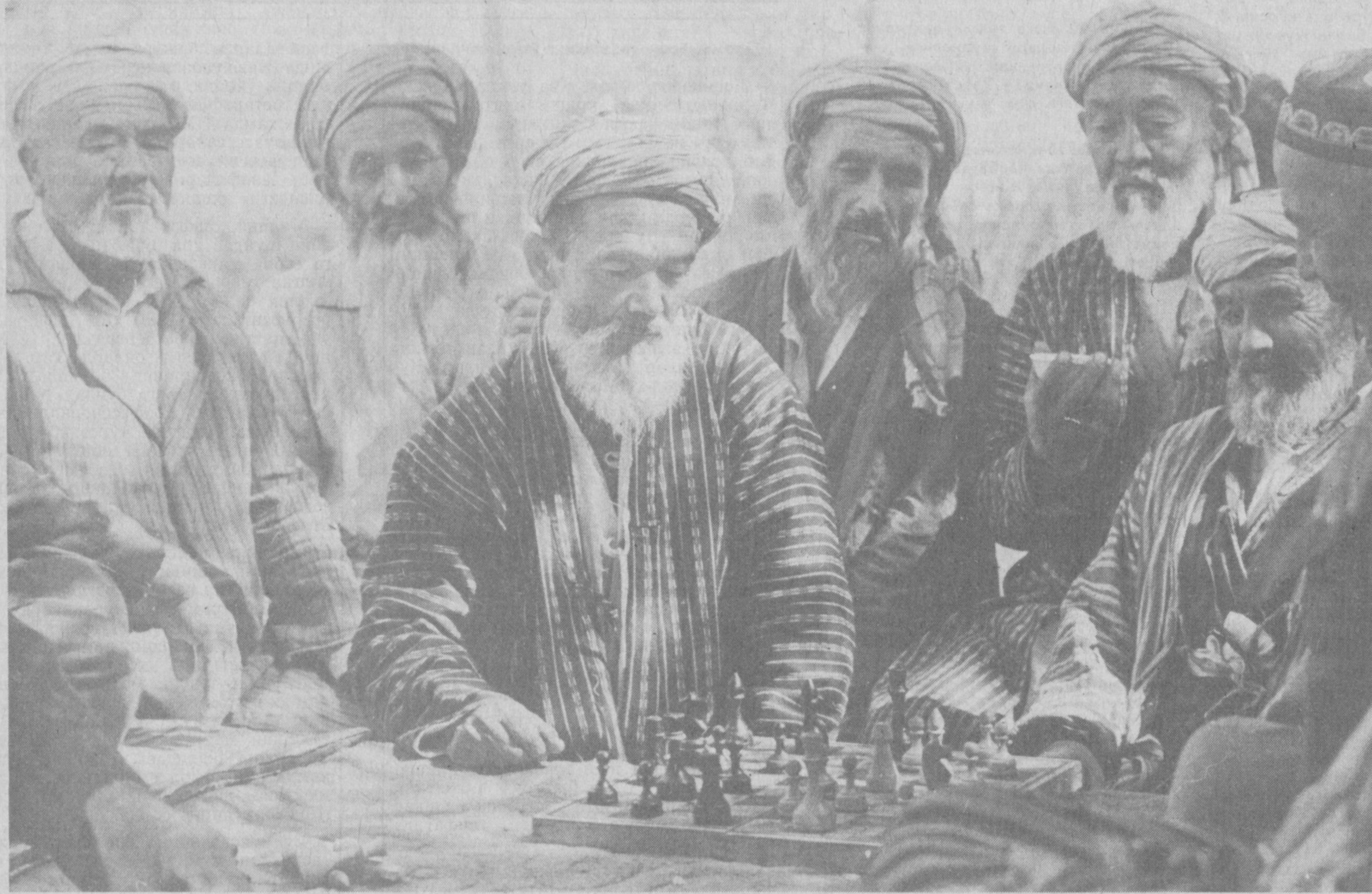
«УТА ХАВФЛИ ЮРИШ».