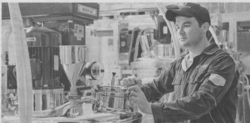
Предприятия столицы оснащены самым современным, высокотехнологичным оборудованием.