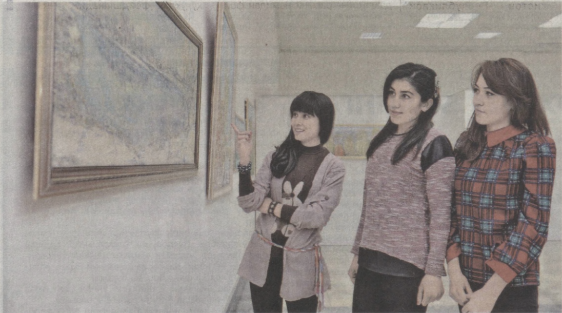
Ўзбекистон Бадий академияси Марказий кўرғазмалар залида «Табият ва рассом» номли анъанавий бадий кўрғазма очилди.