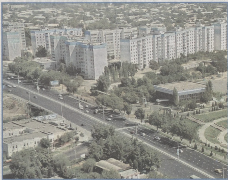
Савол: Тошкент шаҳрида нечта лицей ва коллеж борлигини биласизми?

Мустақил Ўзбекистонимиз танлаган ўз тараққиёт йўлидан дадил одимлаб, юксак марраларни эгалламоқда. Истиклол йилларида Президентимиз раҳнамолигида мамлакатимизнинг барча ҳудудларида бўлгани каби, пойтахтимиз Тошкент шаҳрида ҳам улкан бунёдкорлик ишлари олиб борилди ва изчил давом эттирилмоқда. Барпо этилаётган маданий-маъмурий иншоотлар, турар жойлар, йўллар ва кўприклар, хиёбонлар, фавворалар, қайта таъмирланиб, янгича ҳусну тароват касб этган қадимий обидалар, қадамжолар гўзал ва бетакрор шаҳримиз кўрғига кўрк қўшмоқда. Пойтахтимиз жамолини кундан кунга очаётган ободонлаштириш ва кўкаламзорлаштириш ишларининг катта ижтимоий ва тарбиявий аҳамиятини, кенг кўламли ўзгариш ва янгиланишлар энг буюк неъмат — Мустақиллик берган имкониятларнинг амалдаги самараси эканини, ватанпарварлик она юртни ўрганишдан бошланишини инobatта олиб, Тошкент шаҳар ҳокимлиги ва «Тошкент оқшоми»