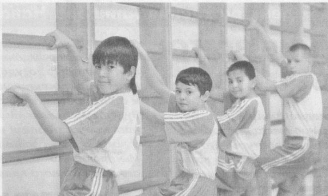
Спорт помогает детям в развитии.