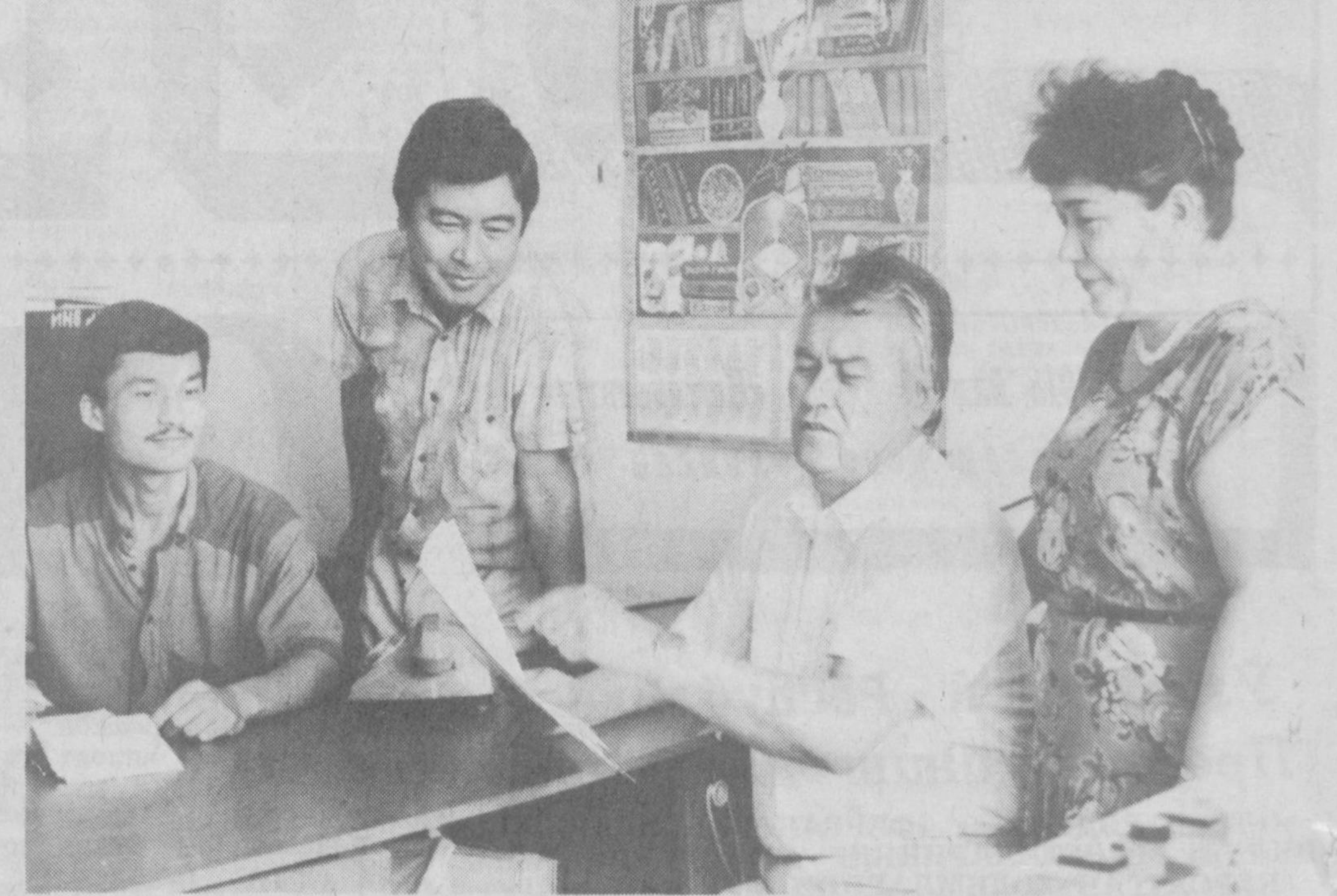
Ўзбекистон Давлат телерадиокомпанияси раҳбарлари ва овоз ёзиш студияси ахборот бosh муҳарририятини ходимлари жумҳурият ҳаётига оид янгиликларни овозинг орқали кўмак-қўриқни тингловчилар оммасига етказишда. Айниқса, «Оқшом тўққизлари», «Душанбадан душанбагача», «Сайёрамиз селоси» сингари эшиттиришлар кўпчиликлари манзур бўлмоқда.

ҳоратини ошириш, уларнинг уй-жой шароитларини ва саномакликларини яхшилаш борасида ҳали анча ишлар қилиниши лозим. Бу ишни эса, бевосита Ўзбекистон Журналистлар уюшмаси амалга ошириши керак бўлади. Агар журналистлар озгина қўллаб-қувватланса, уларнинг мустақиллиги мустаҳкамлашга қўшадиган ҳиссалари юз баробар ошадди, деб ўйлайман.