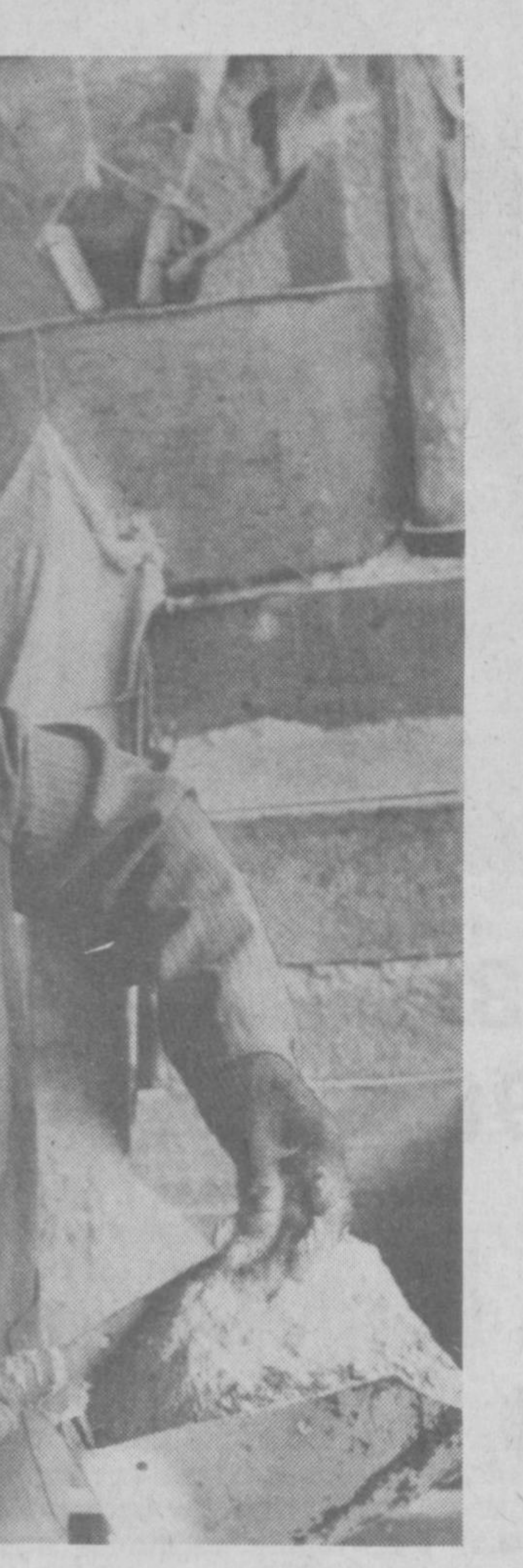
Кўзи тўқининг — кўнгли тўқ Ҳақиқатан ҳам шундай. Кўн жойларда талон билан берилмаган ун қундалик рўзор учур етарли бўлса-да, ҳар кун ион ёлғишга тўғри келадиган қишлоқ жойларда бу албатта, қаллиқ қилади. Шунинг учун кўпгина хўжалиқларда тегирмонлар қурилиб, аҳолининг унга бўлган эҳтиёжини ҳўжалиқлар ҳисобидан қондириб келинмоқда. Мана бир Вилдирки, Шароф Рашидов туманининг Пахтабобо давлат ҳўжалиқига истироат қилувчи аҳоли учун ун муаммоси тўла ҳал этилган. Қишлоқнинг энг хўрватли кишилардан бўлган нуруий отахон Марди бобо Тангиров бошқарётган янги тегирмон қўнғага 1,5 тоннагача ун тортиб, аҳолига манзур бўладиган хизмат кўрсатмоқда.

Олимжон УСАНОВ, «Ўзбекистон овози» муҳбири.