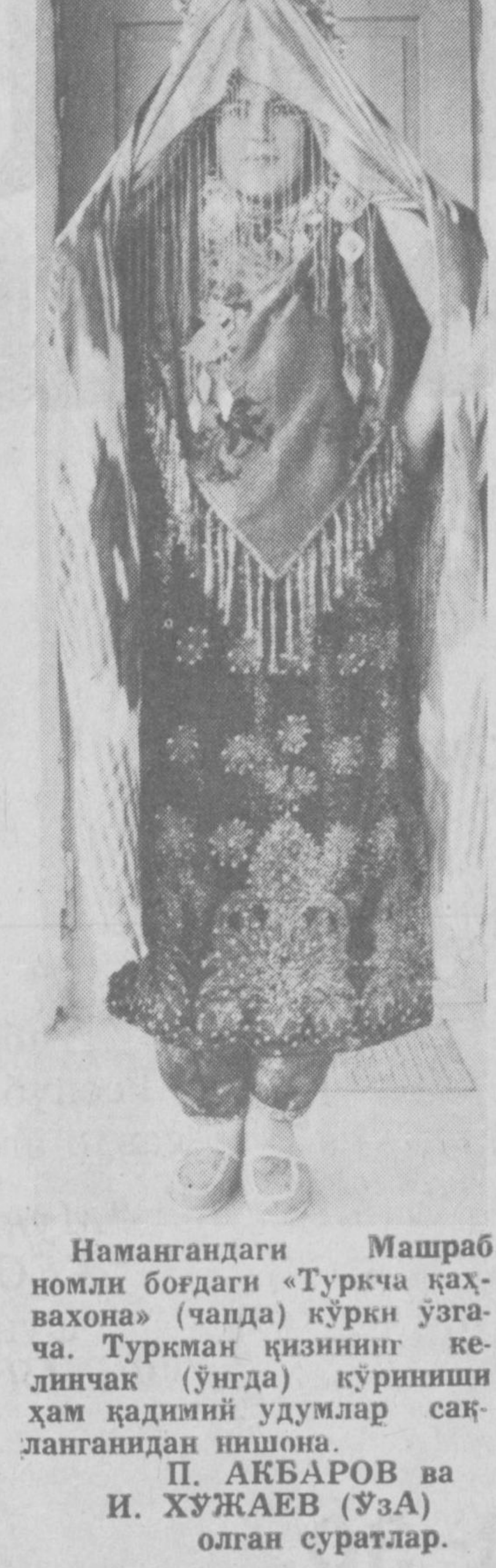
Намангандаги Машраб номидаги боғдаги «Туркча ҳаваҳона» (чапда) кўрғи ўзгача.