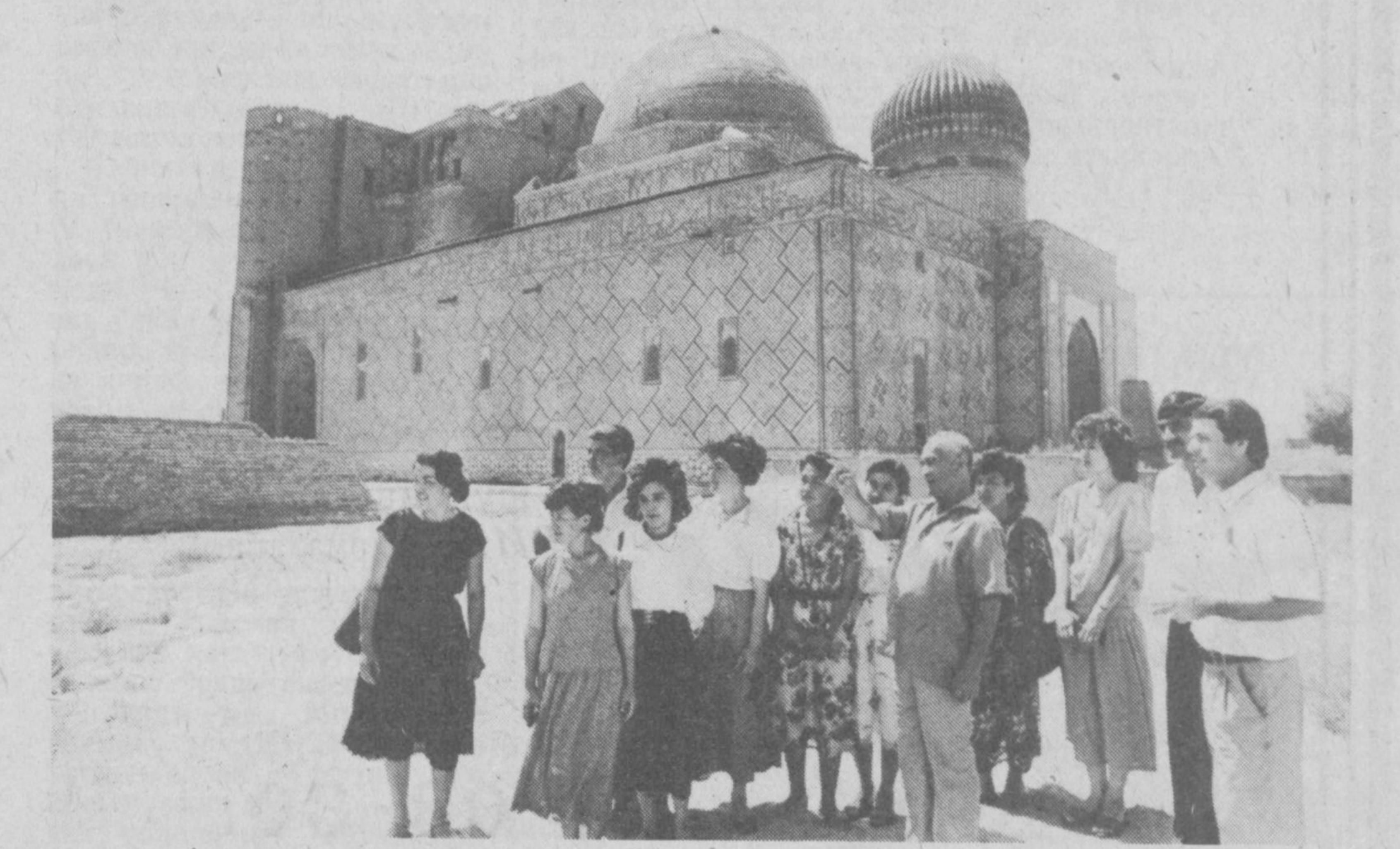
СУРАТДА: бир гуруҳ талабалар тасавуф оламнинг йирик намояндаси Аҳмад Яссавий туғилган юртини зىёрат қилишмоқда.