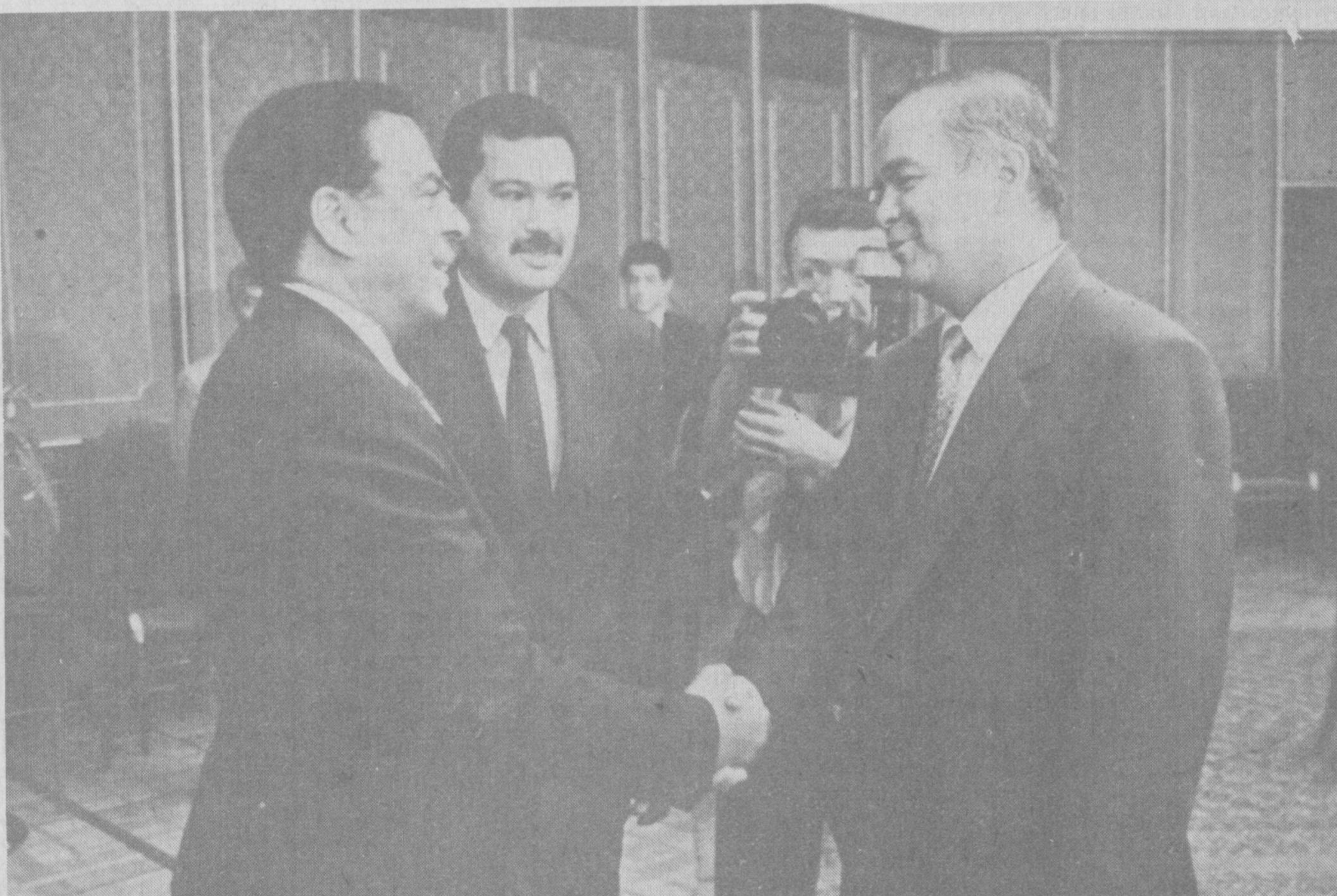
Суратда: қабул пайти.

ратжалари учун фойдаланилади. 2. «Ўзбекистон Республикаси Давлат божхона қўмитасини ташкил этиш тўғрисида» Ўзбекистон Республикаси Президентининг 1992 йил 10 августдаги фармони-нинг валюта тушумларини тақсимлашга тааллуқли 10-банди ўз кўчинин йўқотган деб ҳисоблансин. 3. Вазирлар Маҳкамаси бир ҳафта муддат ичида вазирликлар, давлат қўмиталари, идоралар ва ҳужалик бошқаруви органлари хорижий валютада олинган давлат божлари, йиғимлари ва солиқ бўлмаган бошқа тўловларини ҳамда уларнинг миқдорларини (ставкаларини) белгиланган тартибда қабул қилсин. Ўзбекистон Республикасининг Президентини И. КАРИМОВ. Тошкент шаҳри, 1993 йил 31 июль.