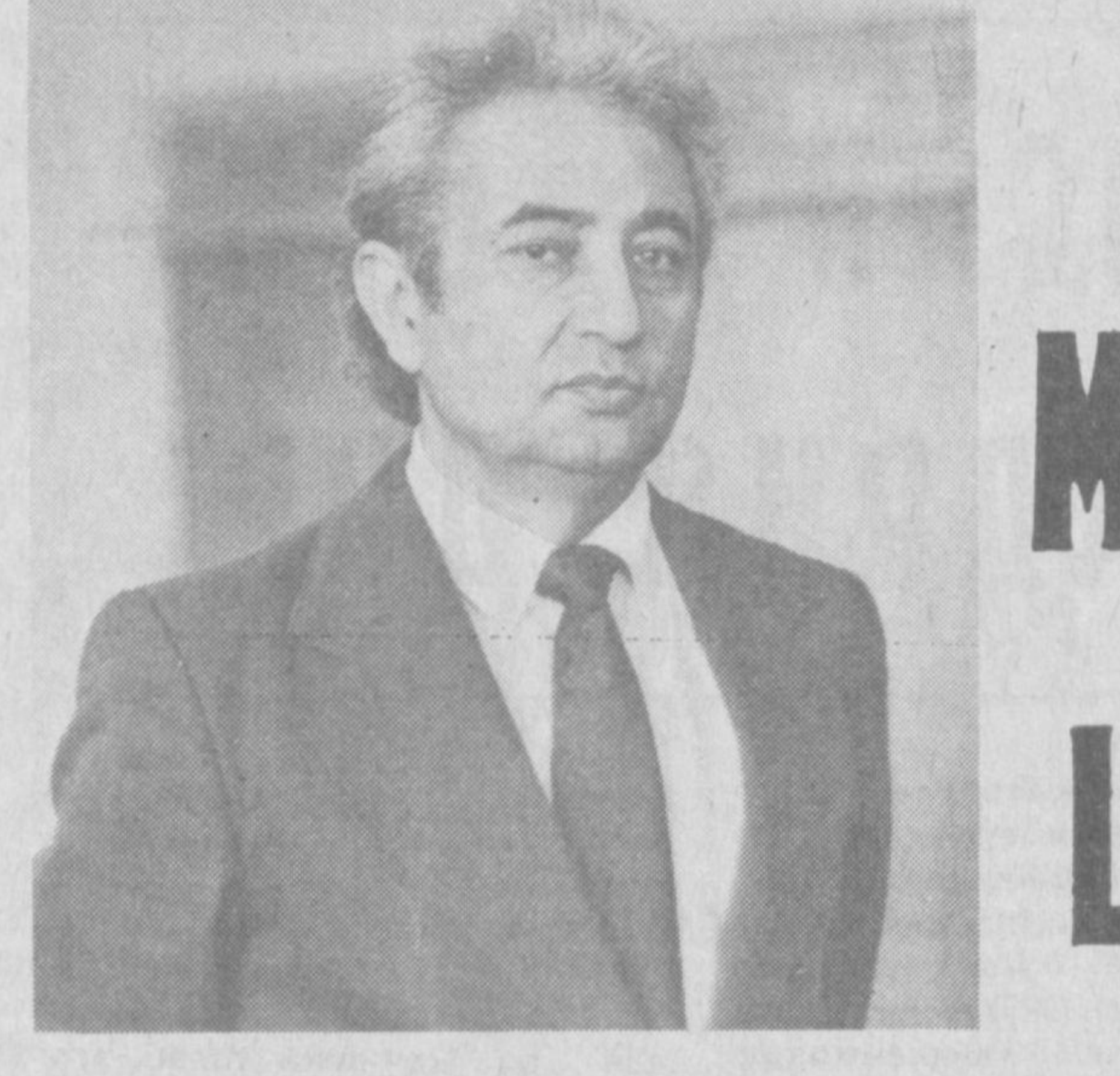
Жамол КАМОЛ, Ўзбекистон халқ шоири.

Ана шу саволга қадим боболаримиз, тасавуф олимлари жавоб беришган... Оламдан мақсад — одамдан мақсад — Худо, Худодан мақсад — камолот, камолотнинг эса чекагараси йўқ, деб таълим беришди улар... Мазноси шуки, инсон дунёга келибдими, ўзини, одамни, оламни танийди. Оламни таниган инсон эса яна олам соҳиби — ҳусни мулқ, меҳри мулқ Оллоҳга талинлади. Ҳусни мулқ, меҳри мулққа талинган инсон эса ҳамини, ҳусни, меҳри, ўқтам ва олийжаноб бўлади. Эки