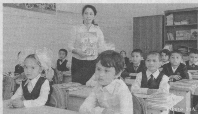
Учитель – профессия благородная.