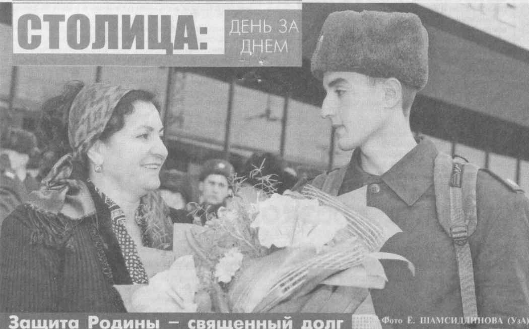
Столица: ДЕНЬ ЗА ДНЕМ Защита Родины — священный долг

На сегодняшних переговорах с представителями узбекской делегации мы обсудили перспективные направления взаимодействия. Нам было интересно узнать, что в вашей стране ежегодно производится более 17 миллионов тонн экологически чистой плодоовощной продукции, свыше 4 миллионов тонн из них экспортируется в 80 стран мира. Это очень впечатляющий показатель. Поэтому мы нацелены на налаживание долгосрочного сотрудничества с Узбекистаном.