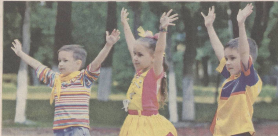
Детство – счастливая пора.