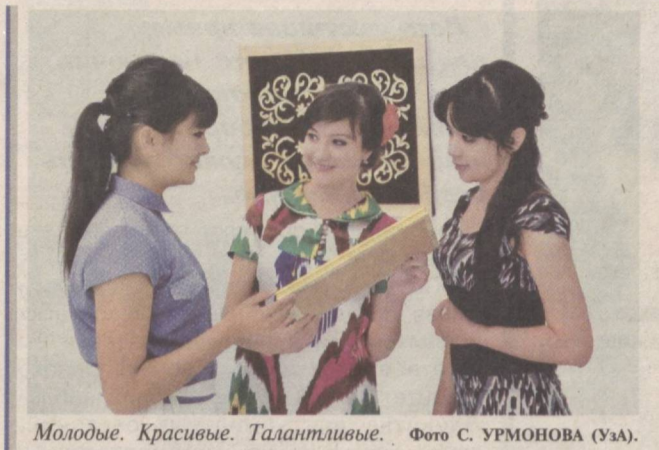
Молодые. Красивые. Талантливые.