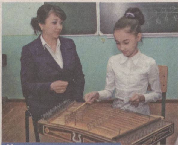
Человек и его дело