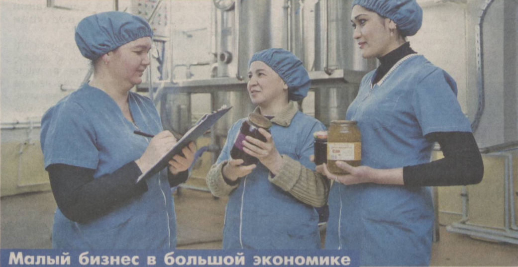
Малый бизнес в большой экономике