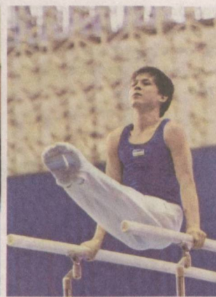
Спорт — путь к совершенству.