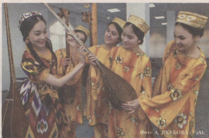
Наша молодежь проявляет огромный интерес к национальному искусству.

Сегодня чрезвычайно важно разъяснять молодому поколению суть и значение проводимой в нашей стране государственной молодежной политики. В то время, когда все больше активизируются информационные нападки, направленные на овладение сердцами и сознанием людей, особенно молодежи, очень актуально формировать у юношей и девушек здоровое мировоззрение и общечеловеческие качества.