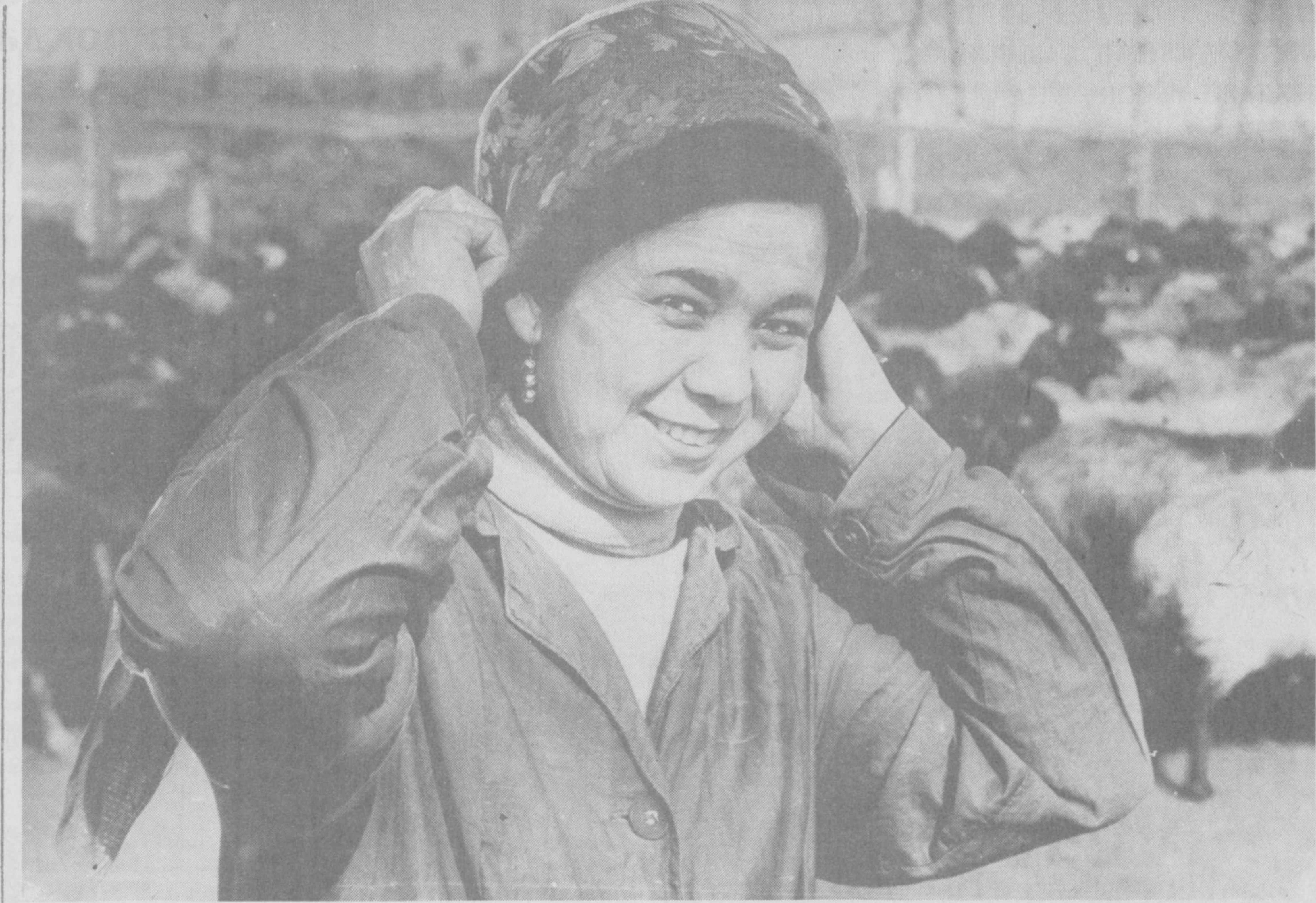
Аёлларнинг қўли гул бўлади, деб бежиз айтишмайди. Зеро, бугунги кунда ҳаётимизнинг хотин-қизлар меҳнат қилмайдиган бирор жабҳасини топиш қийин.

Ўзбекистон ОМИРЗАЕВ, Ўзбекистон ва Қорақалпоғистон халқ ёзувчиси.