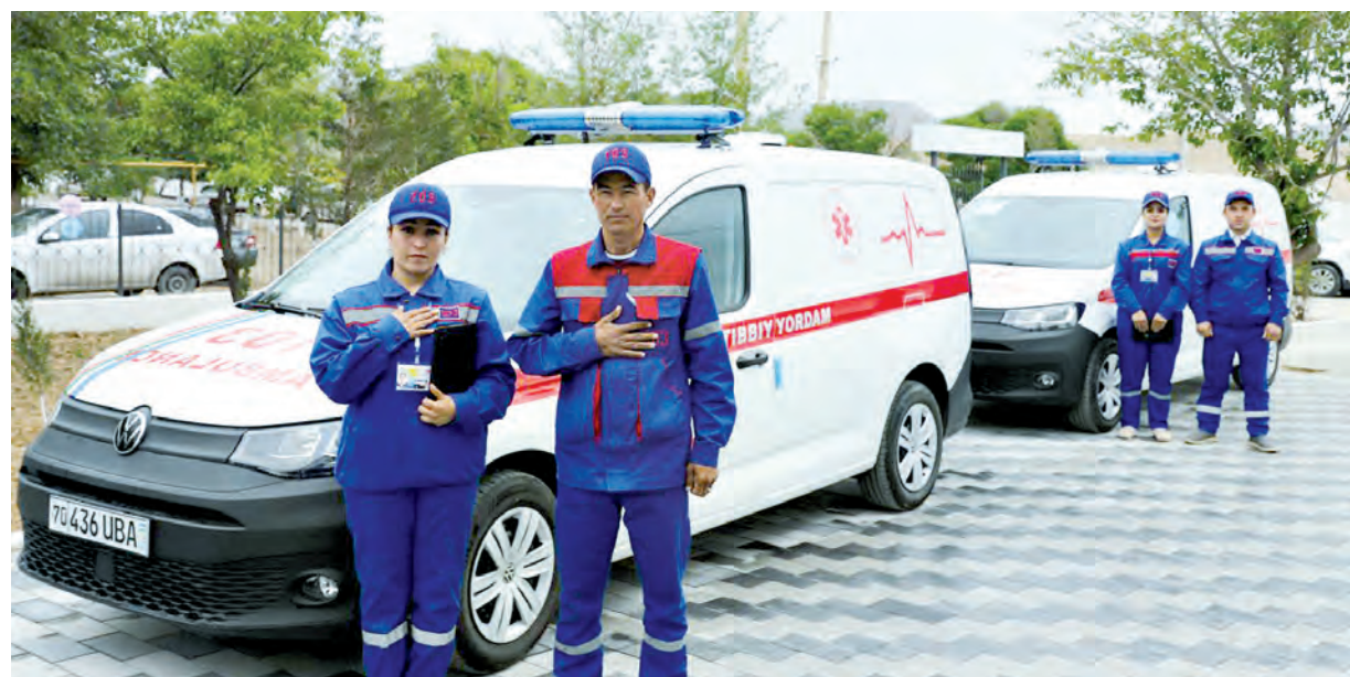
«Окончание. Начало на 1-й стр.»

По имеющимся сведениям, от лишнего веса страдают в основном молодые мамы. Работа по хозяйству, уход за маленькими детьми отнимают много времени. А правильное питание и занятия физкультурой не берутся во внимание. Детские сады - отличное решение проблемы. Ведь все имеют право ухаживать за собой, заботиться о своем здоровье, интересно проводить досуг. Современные сельчане понимают, что сегодня реформы в стране проводятся во имя чести и достоинства человека.