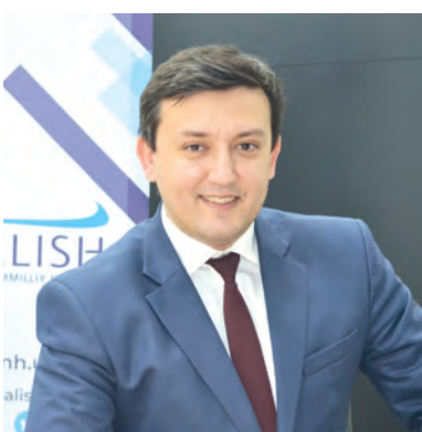
Бобур Бекмуродов. Член Комитета Законодательной палаты Олий Мажлиса по демократическим институтам, негосударственным организациям и органам самоуправления граждан.

нестабильность в глобальной экономике, дефицит продовольственных и энергетических ресурсов, усугубляются экологические проблемы.