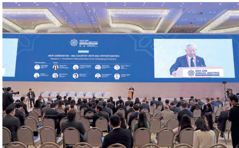
«Окончание. Начало на 1-й стр.»

Узбекистан вновь продемонстрировал свою приверженность глобальному сотрудничеству и устойчивому развитию. Осуществление новых проектов и стратегий, озвученных на саммите, позволит продолжить либерализацию экономики, повысить уровень жизни и доходов населения за счет реализации многомерной программы сокращения бедности и активной поддержки предпринимательства, а также создания новых рабочих мест.