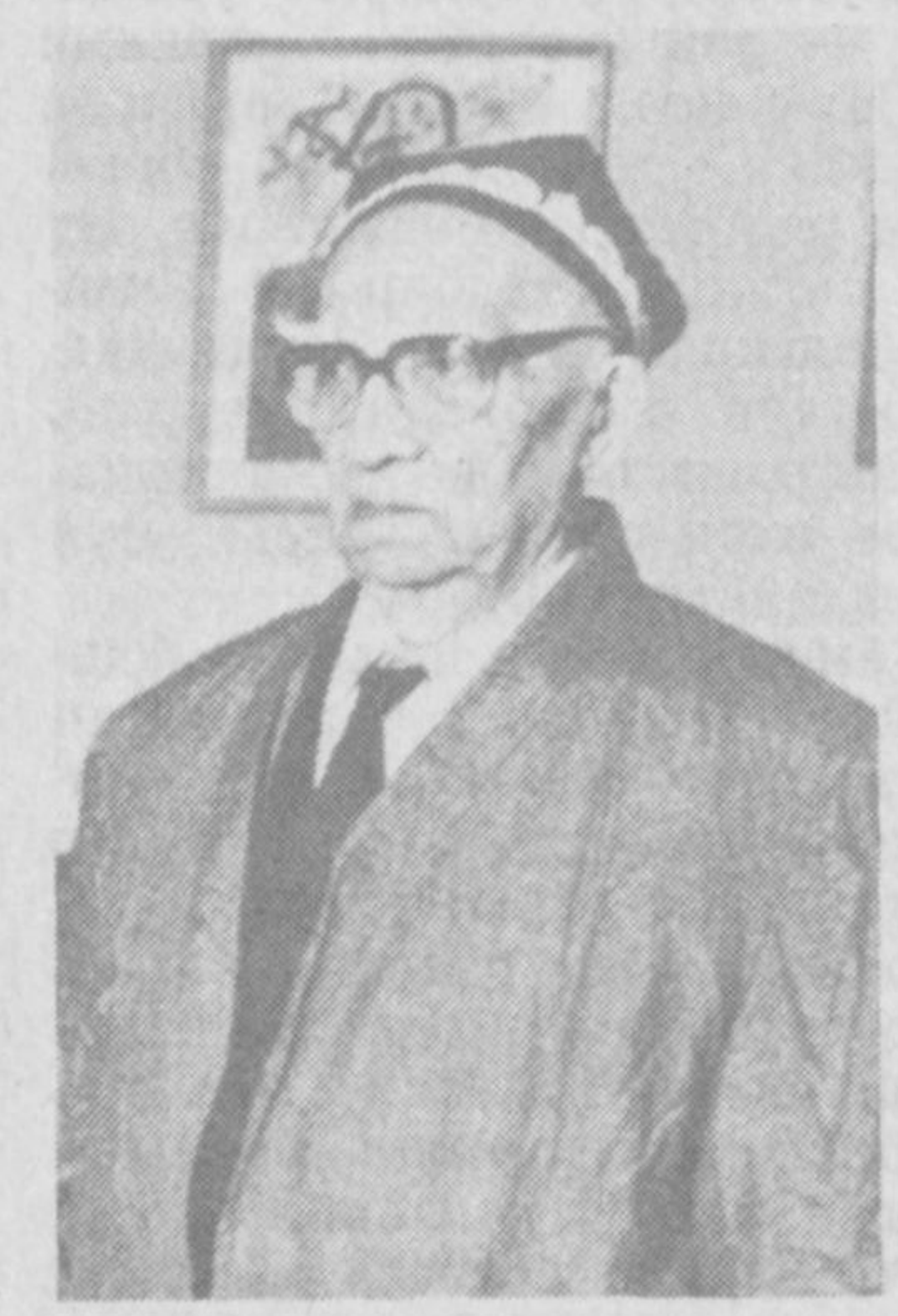
фан арбоби уновни билан тақдирлади.

«Газетамизга «Қизил Ўзбекистон» деб от қўйди. Газетани шундай аташимиз қўққисдан бўлмастан, бунинг остида чуқур тарихий тилгамиш беркиниб туради... Бу кун буюк ишга қаттиқ ва соғлом асос қўйилган кундир ва бу асосга тебраниб (таъниб дейилмоқда) туриб оқ йўлимиздаги қора тўсиқларни енгиб, га-лаба қилшимизга ҳеч шуб-ҳа йўқ, мана шу заҳматли курашда илгари маълум бўлган, ҳозирда чиройли бахтининг чирогини узоқдан кўриб турган ўзбек меҳнат-кашларининг гўлиб чиқиши йўлида «Қизил Ўзбекистон» бел боғлади».