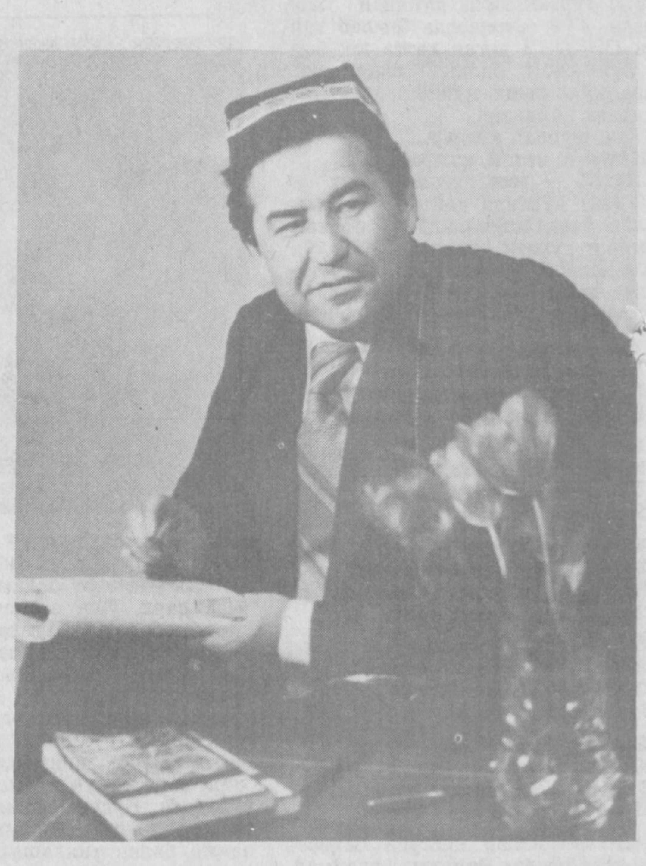
1979 йил, март.

қўллари қовушаверарди. Паллов дамлаш жони-диллари эди. Кўнунча дам олиш кўнлари менинг ошкандан чиқариб юборардилар-да, бир ўзларини ош дамлардилар. Лекин кўпроқ ҳамир овқатини кўш қўралдилар. Дадасининг шундай тарбиялари, «тартиб»ларидан худдо шўқр, икки қизим тушган жойида тинч, ўлим ҳам оиласи билан аҳил. Ҳозир кенжасини уйлаш ниятидаман.