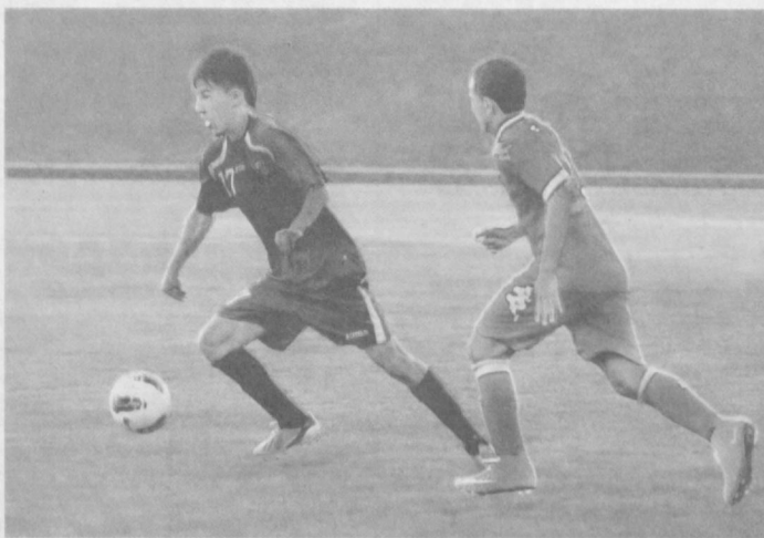
В стремлении к победе.