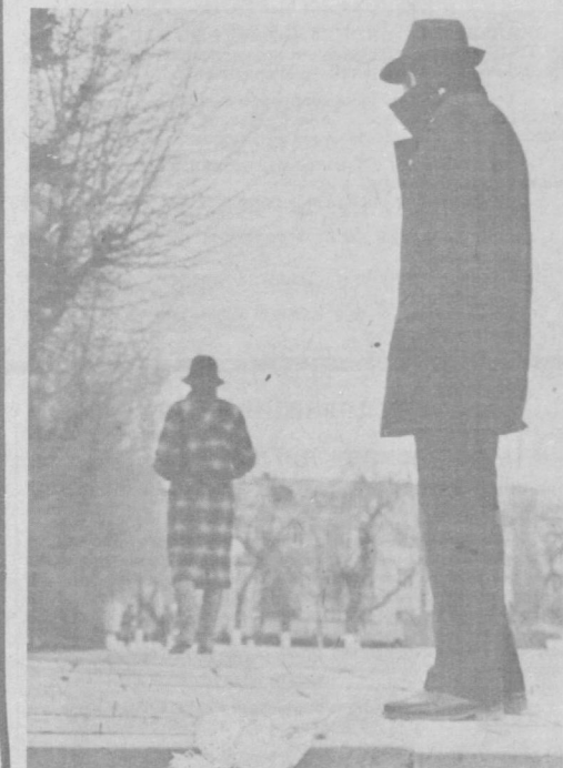
Догнать или не стоить.