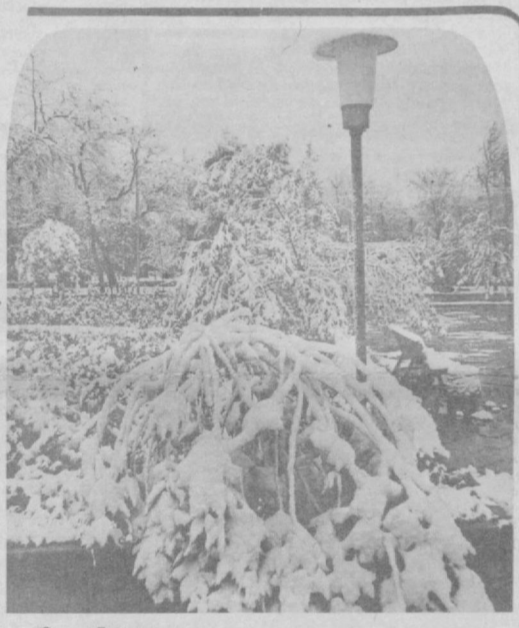
Снег в Ташкенте.

В честь десятилетия революционных событий в Ташкенте по решению Ташсовета у входа в здание вагоноремонтного завода.