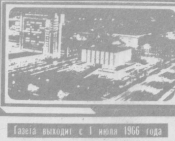
Газета выходит с 1 июля 1966 года