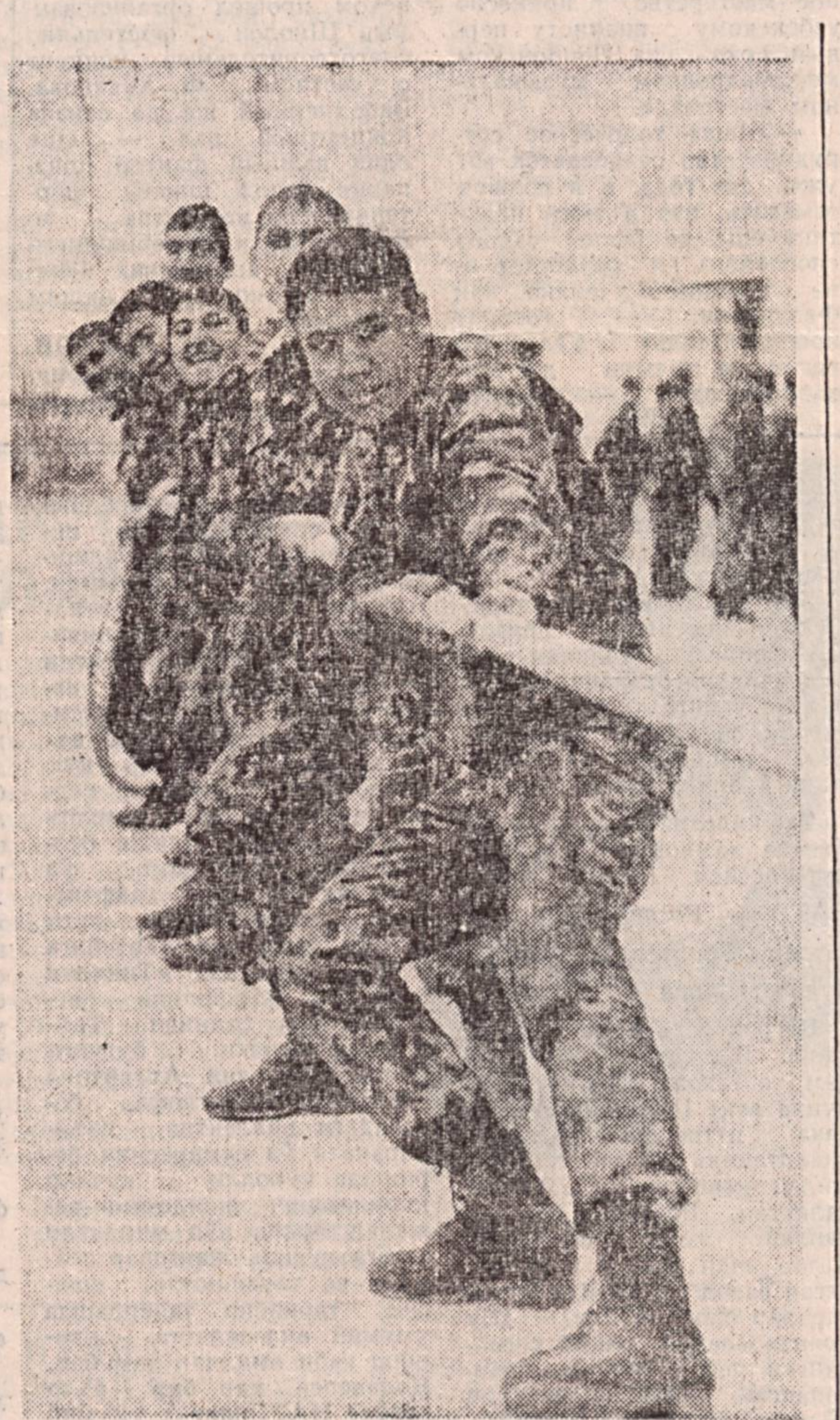
«Бирлашган ўзар», деган нақд бор ҳалқимизда. Турли спорт беллашулари жамоа посбонларини ўзаро бириштиришда, ушқоқлик билан ҳаранат қилишларида муҳим. Аслида галабанинг асосий омилли ҳам ана шунга боғлиқда.