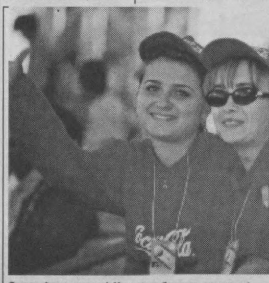
Опять фотокамеры! Уже и поболтать не дают!

Хотя название этого альбома вольную привязано к давно прошедшему празднику, новогодней, по сути, в нем оказалась только заглавная песня, которую музыканты исполнили (в разных вариантах) аж четыре (!) раза. Все ост-