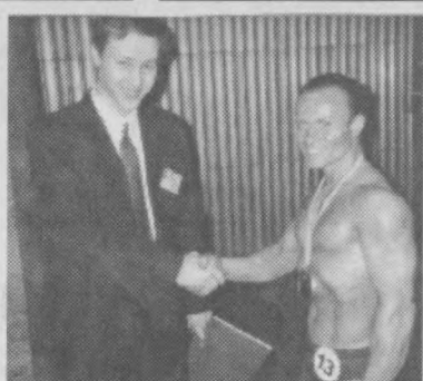
ном Ташкента по гиревому спорту, и это помогло мне восстановиться.

— При подготовке к прошлым соревнованиям физических возможностей у меня было значительно больше, однако выступить мне помешала травма руки. Но за это время я успел стать чемпио-