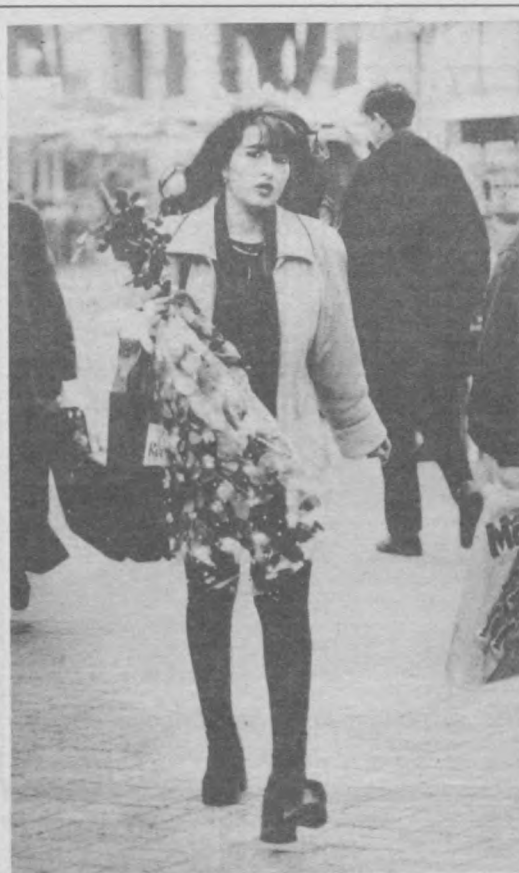
Весна идет, весне дорогу!

12 марта – в Розовом зале Дома кино в рамках рубрики «Арт-Хаус» зрители смогут увидеть фильм режиссера Мануэля Гомеса Перейры «Голос мой, голос твой». В главной роли – Хавье Бардем. Начало в 18.30.