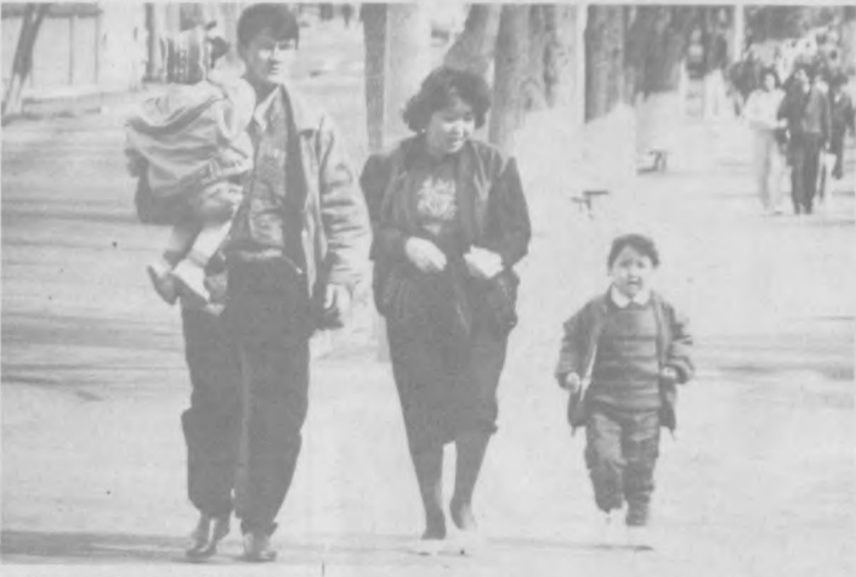
Мама, папа, я — дружная семья.

стально смотреть в одну точку, а возле зрачков проступила темная траурная полоска. Осторожно помахивая, он вдруг сказал: «Все зависит от того, с кем окажешься в лодке. Если рядом будет лучший друг, надо крикнуть: «Мирный Корабль! В этом страсти возгласе было столько искренней надежды и веры, что все невольно повернулось в ту сторону — куда указывала его рука, пытаясь разглядеть несуществующее сплетение оконных рам. За ними была обыкновенная весенняя городская улица с яркой голубиной небой, пробивающейся зеленым и омытыми недавно прошедшим дождем зданием. — Ну и что? — спросил сидевший рядом. — Откуда вдруг возьмется корабль? — Да ниоткуда, — Винни Пух досадливо махнул рукой. — Просто, когда он отвернется, ну, как все вы, я ударю его веслом по голове.