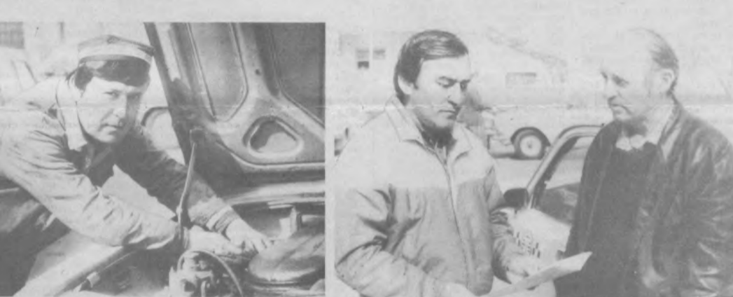
Транспорт: час «пик»