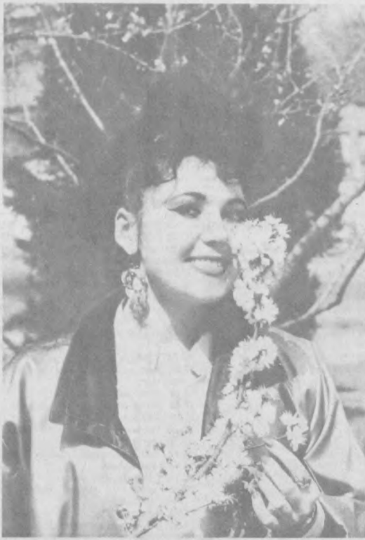
Портрет на фоне весны.

Праздничное настроение, оставшееся у всех по окончании рок-фестиваля, настраивает однозначно — таких встреч должно быть больше. Э. СЕРГЕВА.