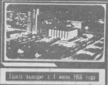
Газета выходит с 1 июля 1966 года