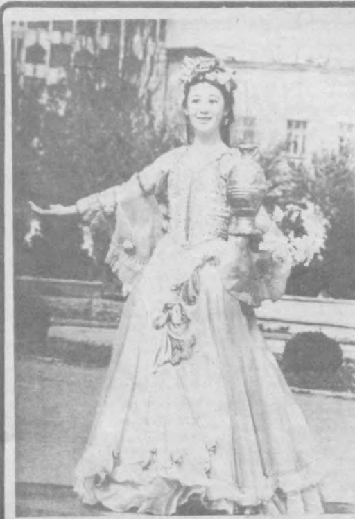
Танец — душа народа.

Сейчас книголюбам с нетерпением ждут последние произведения писателя — «Генерал в своем лабиринте» и «12 странствующих рассказов».