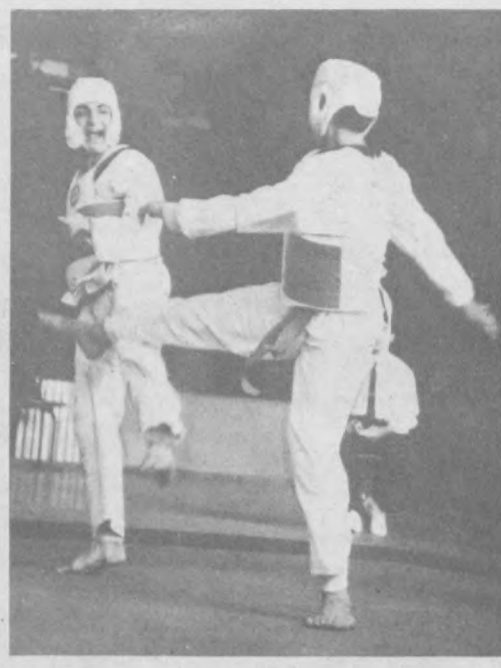
Спорт смелых.

Увиденное зло — это уже непобедимое зло, а оставшее уже будет зависеть от вашей настойчивости. Неопознанное же зло любит маскироваться под свою противоположность, и человек бездумно множит хаос, искренне полагая, что действует во имя добра.