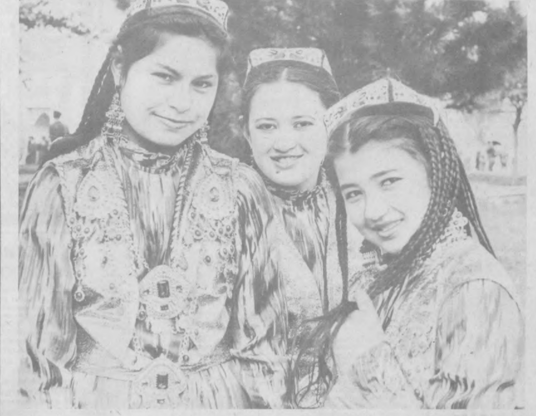
Собрал материал В. АНТОШКИН.

— Отец спрашивает сына: — Зачем ты чистишь зубы семь раз подряд? Ведь pesta сейчас стон дешевой! — Чтоб целую неделю не чистить!