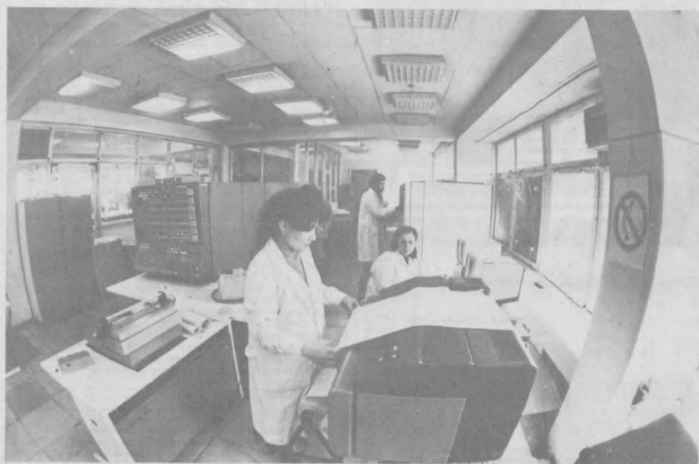
Сложнейший процесс сбыта электроэнергии, управление магистральным строительством, материально-техническим снабжением, бухгалтерский учет — все это вложено на себя предприятие по наладке и эксплуатации автоматизированных систем управления Министерства энергетики и электроресурсов Республики Узбекистан. За тридцать лет своего существования небольшой отдел превратился в одно из главных подразделений министерства.

За минувшие три десятилетия здесь сменилось несколько поколений ЭВМ. Во многом благодаря «умным» машинам удалось значительно снизить расход энергии и топлива, добиться снижения себестоимости электроэнергии.