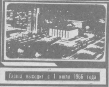
Газета выходит с 1 июля 1966 года

Состоялись собрания активов Бухарской, Наманганской, Кашкардарьинской областей, в которых рассмотрены вопросы ускорения социально-экономического развития областей в свете требований, высказанных Президентом Республики Узбекистан И. А. Каримовым на сессиях Джизакского и Сурхандарьинского областных Советов народных депутатов.