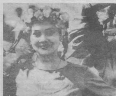
Весна, Навруз, радость...