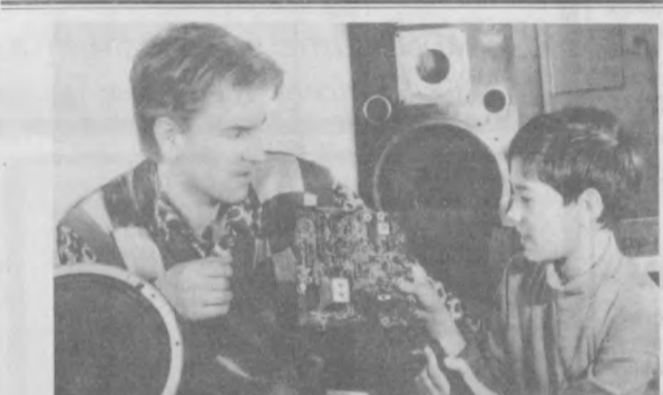
За здоровое поколение