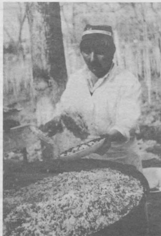
Праздничный плов — это что-то особенное!

Женщина стоит на перроне и громко рыдает. К ней подходит носильщик. — Что случилось? — О Боже! Я опоздала на поезд! — Намного? — На две минуты... — А верешив так, будто по крайней мере на два часа! *** — Почему у тебя синяк под глазом? — А пусть не лезут!