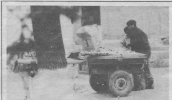
Пример оперативного ответа на вопрос времени: «передвижной» пункт приема стеклопосуды...