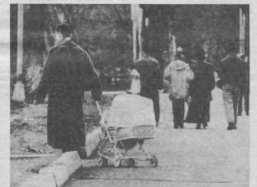
Колеску толкают или тянут?..

По вопросам доставки обращаться в почтовые отделения по месту жительства или в отдел эксплутации ГСП «Ташкент- почтаси» по телефону 133-74-05. Типография издательско- полиграфического концерна «Шарк». Адрес предприятия: ул. Буюк Турон, 41.