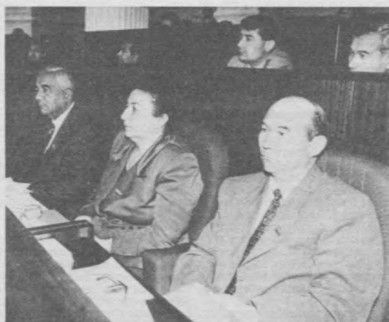
Ташкент. 14 апреля. В зале заседания сессии Олий Мажлиса Республики Узбекистан.