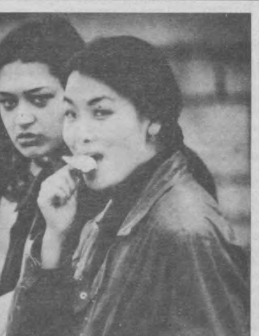
Группа «Blondie» «No Exit», 1998

Группа «Калинов мост» «Оружие», 1998. Четыре года «Калинов мост» не подавал о себе ни слуху, ни звуку.