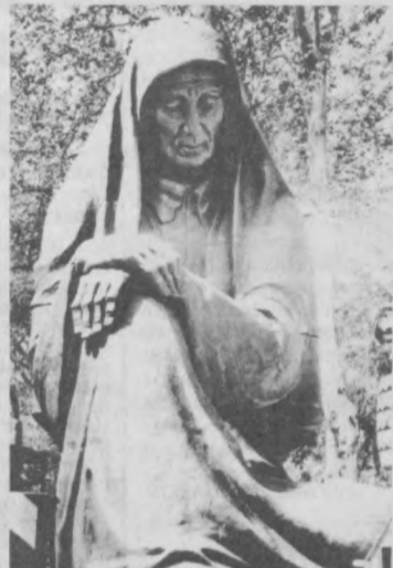
А. ВОЛОКО.

Память получает зримое воплощение. В Ташкенте будет теперь мемориал — торжественный, величественный, вызывающий чувства светлой скорби, благоговения и надежды. Площадь Памяти. Решенный в духе традиционной национальной архитектуры, этот памятник говорит и о пре-