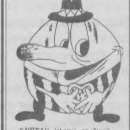
КАРТАН НА МНЕ ЗЕЛЕНЬИ, А СЕРДЦЕ, КАК КУМАЧ. НА ВКУС, КАК САХАР, СЛАДОК, НА ВИД ПОХОЖ НА МЯЧ. (Арбуз) (У)