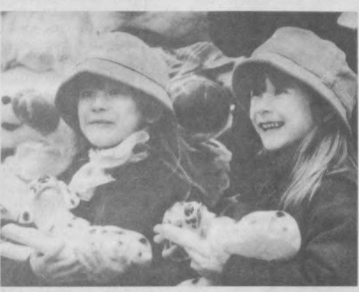
Найдите десять различий между этими девочками...