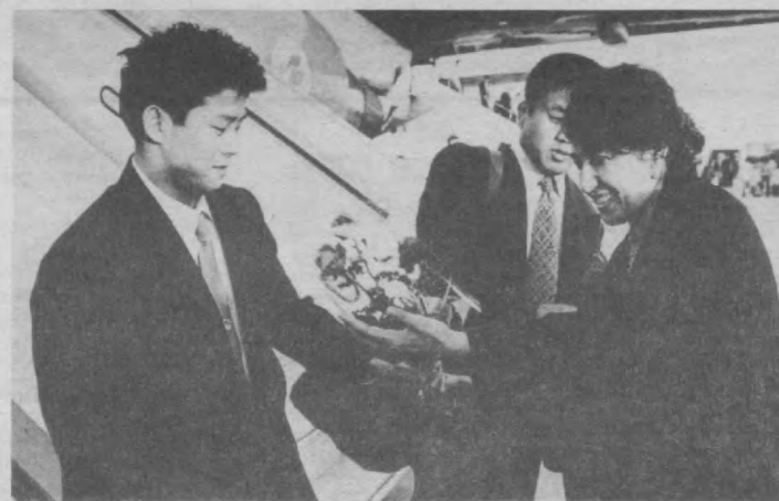
НА СНИМКЕ: во время встречи японских спортсменов в столичном аэропорту.