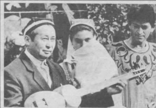
Перед выходом на площадку.

3 и 4 мая — во Дворце искусств («Панорамный») и в «Star Prestige Club» пройдут концерты популярной российской группы «НФ!» с суперпрограммой «Танцы до упаду». Начало — 3 мая во Двор-