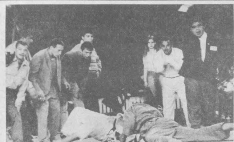
Спортсмены и болельщики.