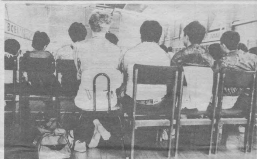
В кроссовках — хорошо, а босиком — лучше...