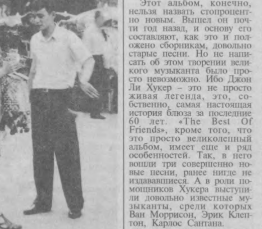
Джон Ли Хукер «The Best Of Friends» — 1998 г.

Первый вопрос к литовским музыкантам возник еще до того, как был прослушан альбом: «Почему, собственно, только блондинки? Чем же это перед нами провинциальнее бронежилет или патетик? Но когда альбом был прослушан, стало ясно: «Блондинки» к блондинкам относятся так же неважно. Ведь посвященное им творение просто ужасно. Если брать музыку, то она — жалкая пародия на