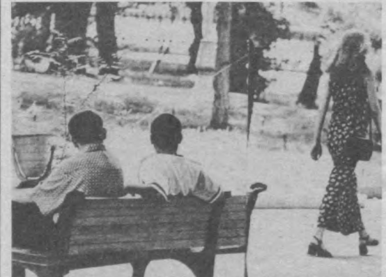
Без слов.

ОВНЫ – начало недели лучше провести в уединении, особенно в понедельник вечером. Постарайтесь избежать экстравагантности. Понедельник и вторник хороши для того, чтобы попробовать новую диету. В среду вам, возможно, захочется приняться за ремонт квартиры – не упускайте благоприятный случай.