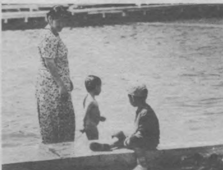
В жаркий летний денек...