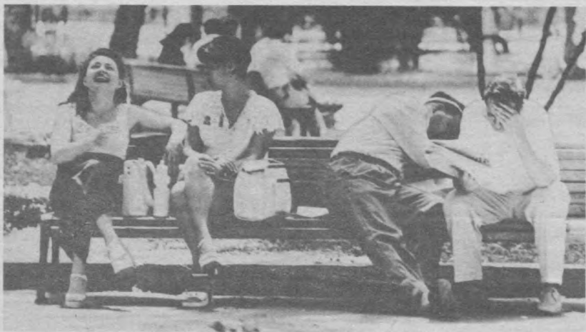
У каждого - свое...

РЫБЫ - даже в будние дни удачными могут оказаться вылазки в город по магазинам: среда благоприятна для приобретения мебельных гарнитуров, а в пятницу побалуйте детей всевозможными приятными сюрпризами и подарками. Выходные постарайтесь провести в дружеской компании.