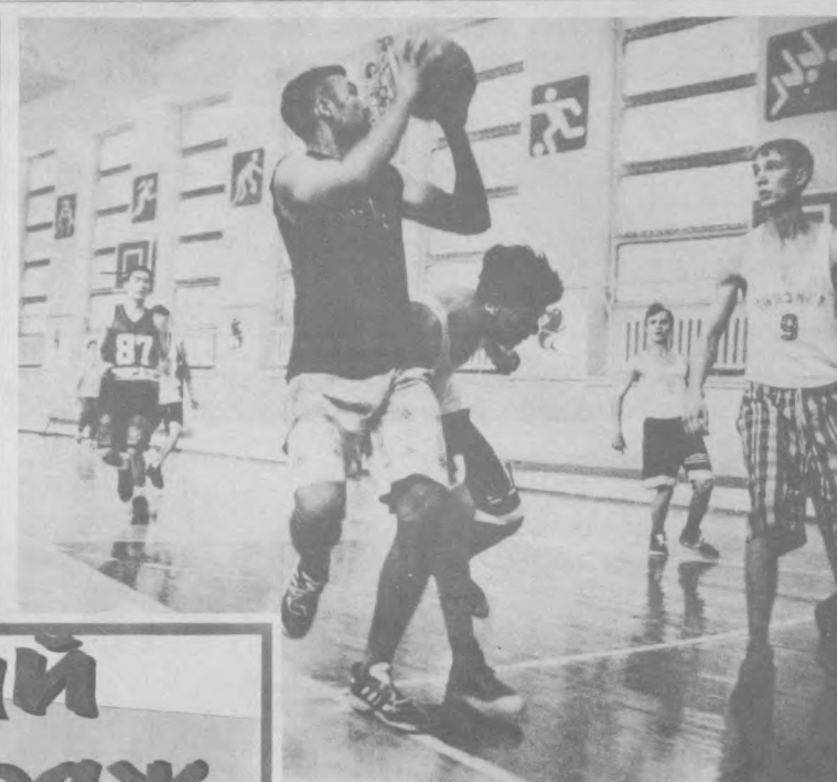
Последний прыжок - и соперник сражен...

них от всех зависит, какая молодежь войдет в XXI век и что возьмет она с собой нас.