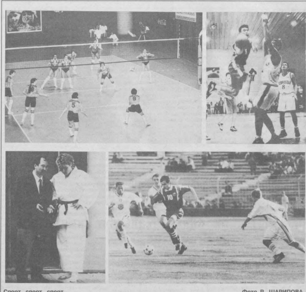
Спорт, спорт, спорт...