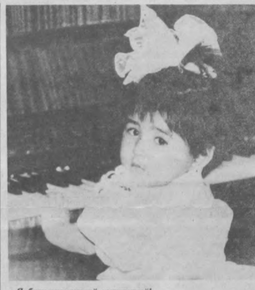
Я буду знаменитой пианисткой!..