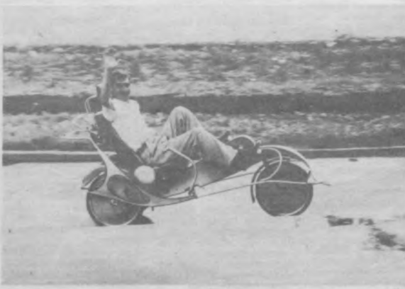
Что за чудо-машина!