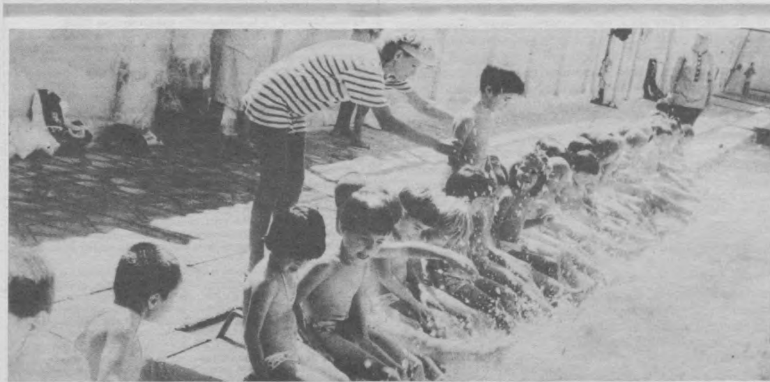
Воспитанники детских садов № 5 и № 6 АО «Таштекстиль» под наблюдением опытных инструкторов закаляют свое здоровье и учатся плавать в бассейне.

Кроме того, необходимо обратить внимание на тот факт, что закон предусматривает предоставление женщинам, достигшим 54 лет, права выхода на пенсию по возрасту при наличии не менее 20 лет трудового стажа на рабочих местах, на которых работник подлежал государственному социальному страхованию (в этот стаж не входит время учебы в вузах, техникумах, однако если женщина служила в рядах Вооруженных Сил, то данный период также засчитывается в трудовой стаж, дающий право ухода на пенсию с 54 лет).