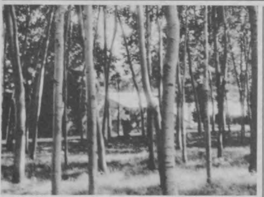
Березовая роща.