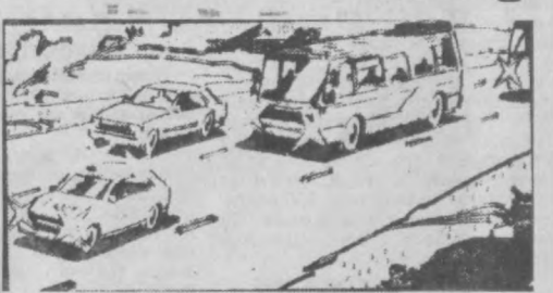
Рис. 1 Как должен действовать в данной ситуации водитель легкового автомобиля?