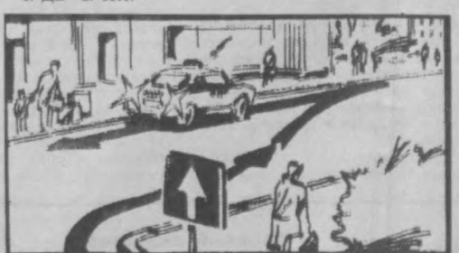
Рис. 4 Может ли водитель на этом участке улицы двигаться задним ходом?