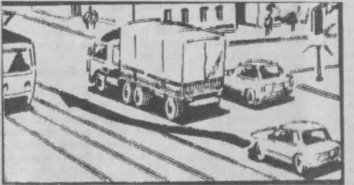
Рис. 2 Можно ли совершить маневр так, как это показано на рисунке?