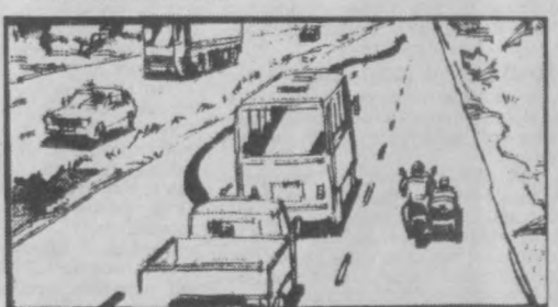
Рис. 3 Соответствует ли правилам такой маневр водителя грузового автомобиля?